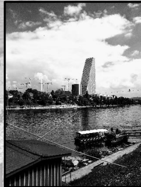
3 St. Alban Fähre