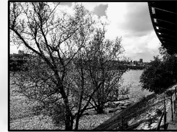
9 Tinguely Museum