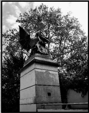
1 Basilisk Statue